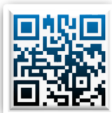
消化道檢查說明書