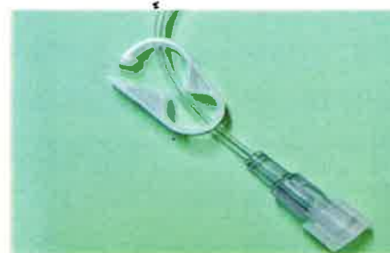
勿關閉管夾(保持開啓)

(三)當注射器滴畢時，勿關閉管夾(空氣不會跑入管內)，若藥物於半夜滴注完畢，可於天亮後再返院移除即可。或意識混亂、嗜睡的情形要儘速看醫師。